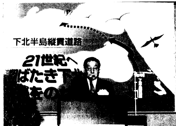
下北半島縦貫道路