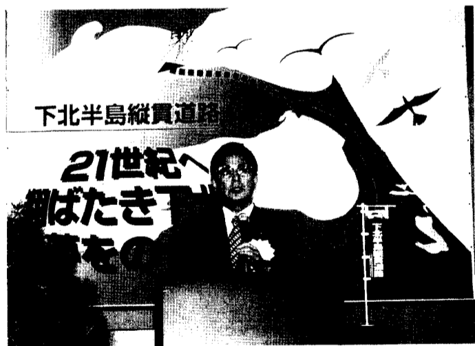
下北半島縦貫道路

景気は変わりつつあるとされており、末端の地域経済はまだまだ厳しく、これからが正念場であると考えておりますので、皆様方のご理解とご協力をお願い申し上げます」と挨拶しました。 引き続き、浜道監事より監査報告がなされた後、議案審議に入り、議案第一号むつ商工会議所平成十一年度事業報告、議案第二号むつ商工会議所平成十一年度決算についての二つの議案全て原案どおり承認しました。